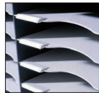
Forme ergonomique pour une meilleure préhension